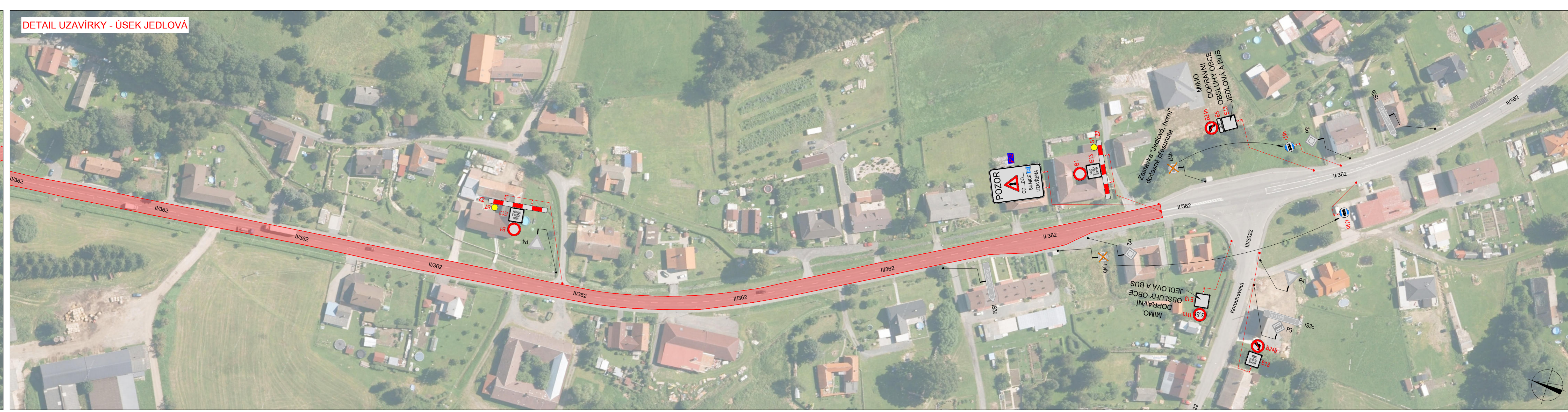
DETAIL UZAVÍRKY - ÚSEK JEDLOVÁ